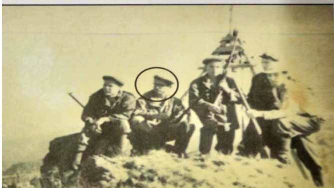
Поисковые работы на Чексинском месторождении. Вершина горы Сох-Тайга. 1958г.