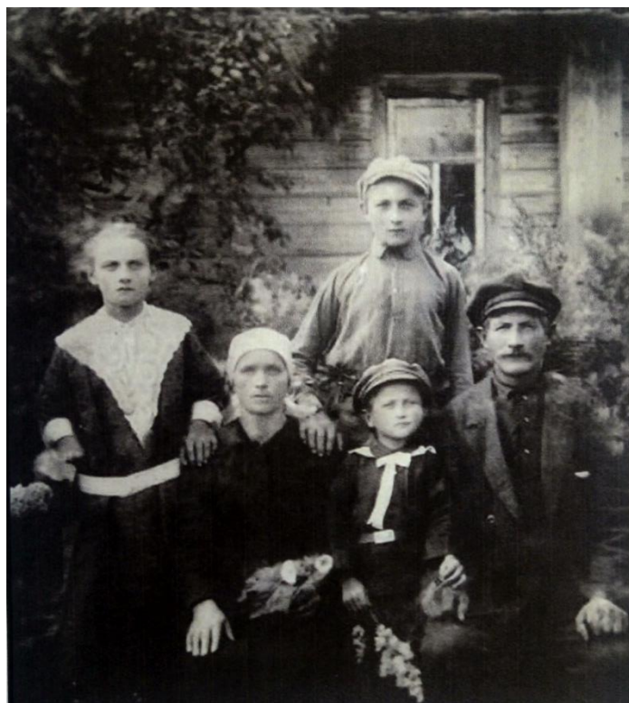
Фото №2. В родном хуторе