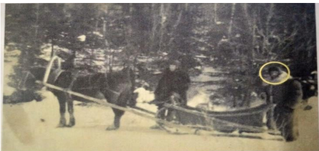
Участки Курейинские. Технологический транспорт геологов. 1955г.